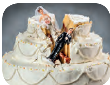
Rita und Lutz sind