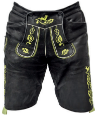
Nahkahousut Saksa, Itävalta

Pohdi, keitä henkilöitä tai mitä asioita ja ilmiöitä kuvissa on. Mihin maahan ne liittyvät: Saksaan, Itävaltaan vai Sveitsiin? Jotkut asiat voivat liittyä useampaan kuin yhteen maahan.